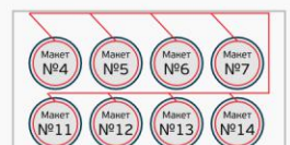
Контур реза для всех элементов сгруппирован отдельно от остальных объектов

ВНИМАНИЕ: ОТВЕТСТВЕННОСТЬ ЗА НЕКАЧЕСТВЕННОЕ НАНЕСЕНИЕ ПО ПРИЧИНЕ НЕСОБЛЮЖДЕНИЯ ТРЕБОВАНИЙ К МАКЕТАМ ЛЕЖИТ НА ЗАКАЗЧИКЕ